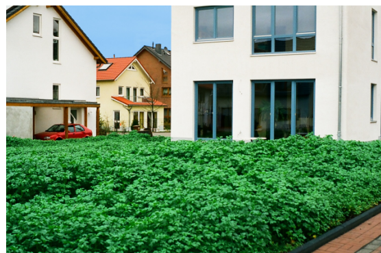
Regeneration baulich beanspruchter Gartenböden mit einer Zwischenbegrünung, hier Senf vor der Blüte.

Falls die Böden trotz aller Vorkehrungen verdichtet wurden, müssen sie fachgerecht bis in die Verdichtungszone gelockert werden. Auch bestehende Schäden aus Vornutzungen sollten gezielt beseitigt werden.