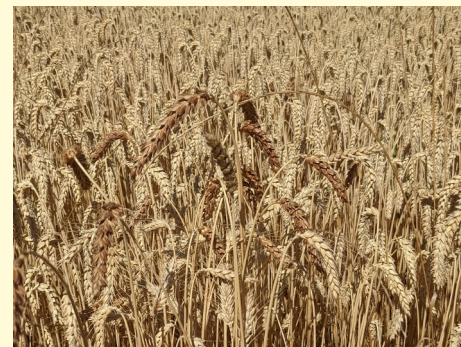
Abb. 1: Fremdbesatz in Weizenvermehrung

Die Einbindung relevanter Partner*innen und die intensive Zusammenarbeit innerhalb der OG ermöglicht es, Herausforderungen anzugehen, die zu Beginn des Vorhabens noch beinahe unüberwindbar erscheinen. Die beständige Beschäftigung mit den Lösungsansätzen kann schließlich zu Erfolgen führen.