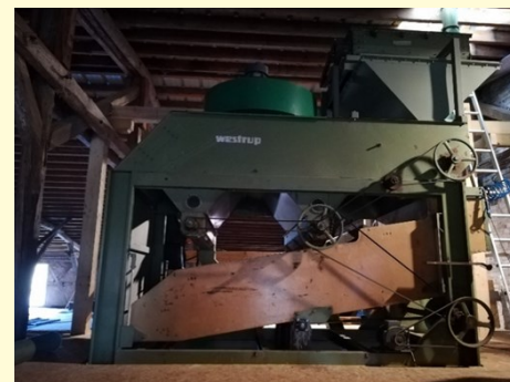
Abb. 3: Siebaufbereitungsanlage auf Gut Mönchhof